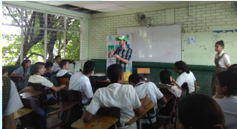
Taller de reuso de materiales aprovechables