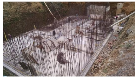
TANQUE DE ALMACENAMIENTO: Armado de acero

Los componentes de la obra, desarenador y la conducción, se encuentran terminados. La red de distribución se ha instalado en un 95% y falta un tramo de 454 ml de la entrada 5 del lago Calima, que no se ha podido ejecutar por oposición del propietario del terreno. A pesar que la Alcaldía está tramitando el permiso respectivo y las dificultades que está