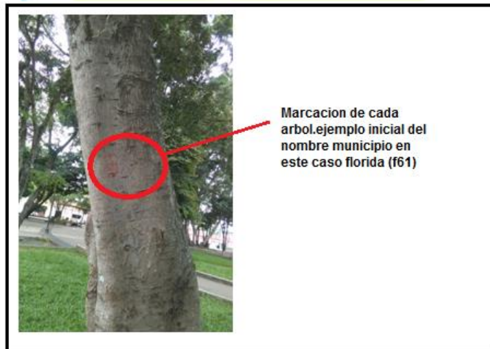
Foto. Árbol municipio de florida