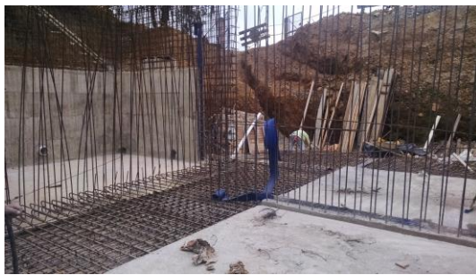
TANQUE DE ALMACENAMIENTO: Armado de acero