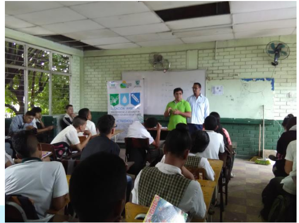
Taller de riesgos ambientales